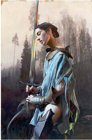
Blut/Blood, 2015 Öl auf Leinwand, 225 x 150 cm Privatsammlung © Martin Eder / VG Bild-Kunst, Bonn 2017; courtesy Galerie EIGEN+ART Leipzig/Berlin Foto: Uwe Walter, Berlin