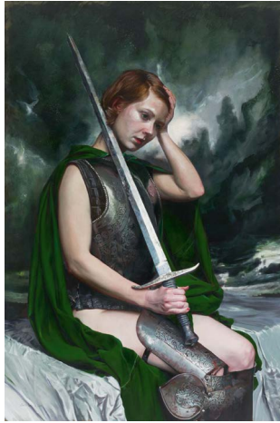
Erkenntnis läuft auf zerriss'nen Sohlen (cognition), 2015 Öl auf Leinwand, 225 x 150 cm © Martin Eder / VG Bild-Kunst, Bonn 2017; courtesy Galerie EIGEN+ART Leipzig/Berlin Foto: Uwe Walter, Berlin

Um falsche Historie und ihr unbewusstes Entstehen geht es dem Berliner Maler Martin Eder in seinen jüngsten Arbeiten. Fake History statt Fake News. In seinen Bildern liegen, lehnen, dämmern Frauen in glänzenden Rüstungen, in zerrissenen Leinwandstoffen oder leuchtenden Umhängen. Starke Frauen, die Spuren von Kämpfen an sich tragen, weniger in Form von äußeren Schrammen als in einem Ausdruck von Anstrengung und Erschöpfung, der sie umgibt. Erwischt in einem kurzen Moment zwischen Wachsein und Schlaf, in ihrer bildlichen Präsenz greifbar nah, aber mit dem