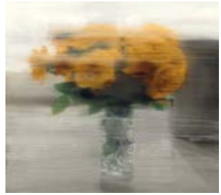
Offset-Druck v. Gerhard Richter »Rosen« © VG Bild-Kunst, Bonn 2016

IM DON QUIJOTE-HAUS KÖNNEN SIE KUNST UND GESCHENKARTIKEL ZU MODERATEN PREISEN ERWERBEN.