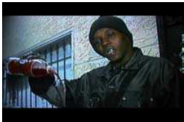
Michael E. Smith The Look of love, 2008 Video ©Michael E. Smith und Koch Oberhuber Wolff, Berlin

Hiermit laden wir Sie und Ihre Freunde ein zur Eröffnung der Ausstellung am Samstag, dem 26. Februar 2011 um 18 Uhr