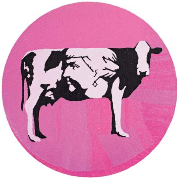
Erinç Seymen, Ohne Titel, 2008 Pailletten und Stickerei auf Satin 199,5 x 199,5 cm