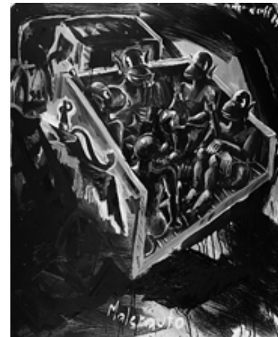
Jörg Immendorff: Malerauto I, 1989, Öl auf Leinwand, 100 x 80 cm, Galerie Michael Werner, Köln