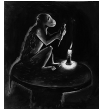
Jörg Immendorff: Malerfreund, 1985, Öl auf Leinwand, 285 x 250 cm, Privatsammlung