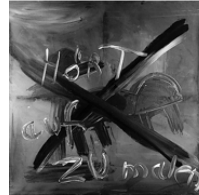
Jörg Immendorff: Hört auf zu malen! , 1966, Kunstharz auf Leinwand, 135 x 135 cm, Stedelijk Van Abbemuseum, Eindhoven

Ein Jahr nach der Grenzöffnung zur ehemaligen DDR unternahm Immendorff mit Kleine Reise (Hasensülze) eine Bestandsaufnahme der Kunstsituation, in der er sich zu diesem Zeitpunkt sah, wobei er auf die Ikonographie früherer Bilder zurückgriff: Zahlreiche Wege durchkreuzen eine dunkle, unwirtliche Landschaft, die vor allem das linke Drittel des Bildes ausfüllt. Dort schreitet eine Gestalt an einem Wegweiser mit der Beschriftung „Front“ vorüber, ein offener Lastwagen mit pinselbewaffneten Passagieren auf der Pritsche („Malerauto“) bewegt sich vom unteren Bildrand über einen steil ansteigenden Weg, der die Landschaft wie eine Mauer durchtrennt; vor ihm ein von der Piste gestürzter Wagen, zu dessen Ladung offenbar der ausgelaufene Farbeimer auf der Fahrbahn gehörte; überall Grüppchen oder einzelne mit Pinseln hantierende Gestalten, seien es die Angler am Teich (die im Trüben fischen?) oder der Maler, der nahe dem rechten Bildrand auf einem abgebrochenen Ast sitzt und die Situation auf seiner Leinwand festhält. Die Sonne ist durch eine runde Scheibe mit einem Zeichen verdunkelt, das an das 1981 entstandene Bild Kein Licht für wen denken läßt .