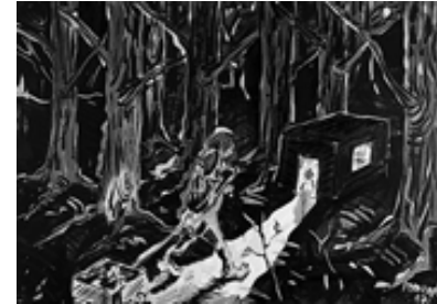
Jörg Immendorff: Kleine Reise 1997, Öl auf Leinwand, 100 x 140 cm, Galerie Erich Bausmann, Mainz

Kunstmuseum Wolfsburg Hollerplatz 1 D-38440 Wolfsburg