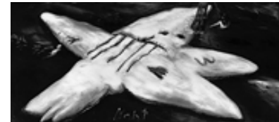
Jörg Immendorff: Naht, 1981, Öl auf Leinwand, 180 x 400 cm, Kunstmuseum Düsseldorf