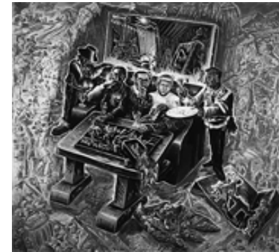
Jörg Immendorff: Readymade de l'histoire dans Café de Flore , 1987/88, Öl auf Leinwand, 150 x 175 cm, Auckland Art Gallery, Auckland City

Malerauto III , 1989, Öl auf Leinwand, 100 x 100 cm, Privatsammlung