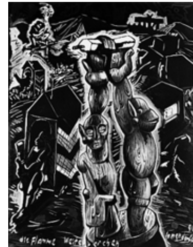
Jörg Immendorff: Die Flamme weiterreichen , 1990, Öl auf Leinwand, 130 x 100 cm, Galerie Michael Werner, Köln