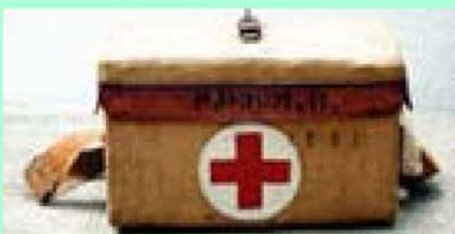
Joseph Beuys` Sanitätskoffer 1979 © VG Bild-Kunst