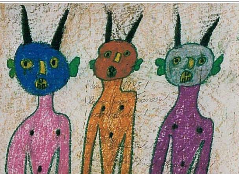
Hans-Jürgen Fränzer Teufel 1995 Kreide, Papier, 43,5 X 61,0 cm, Sammlung Kunsthaus Kannen