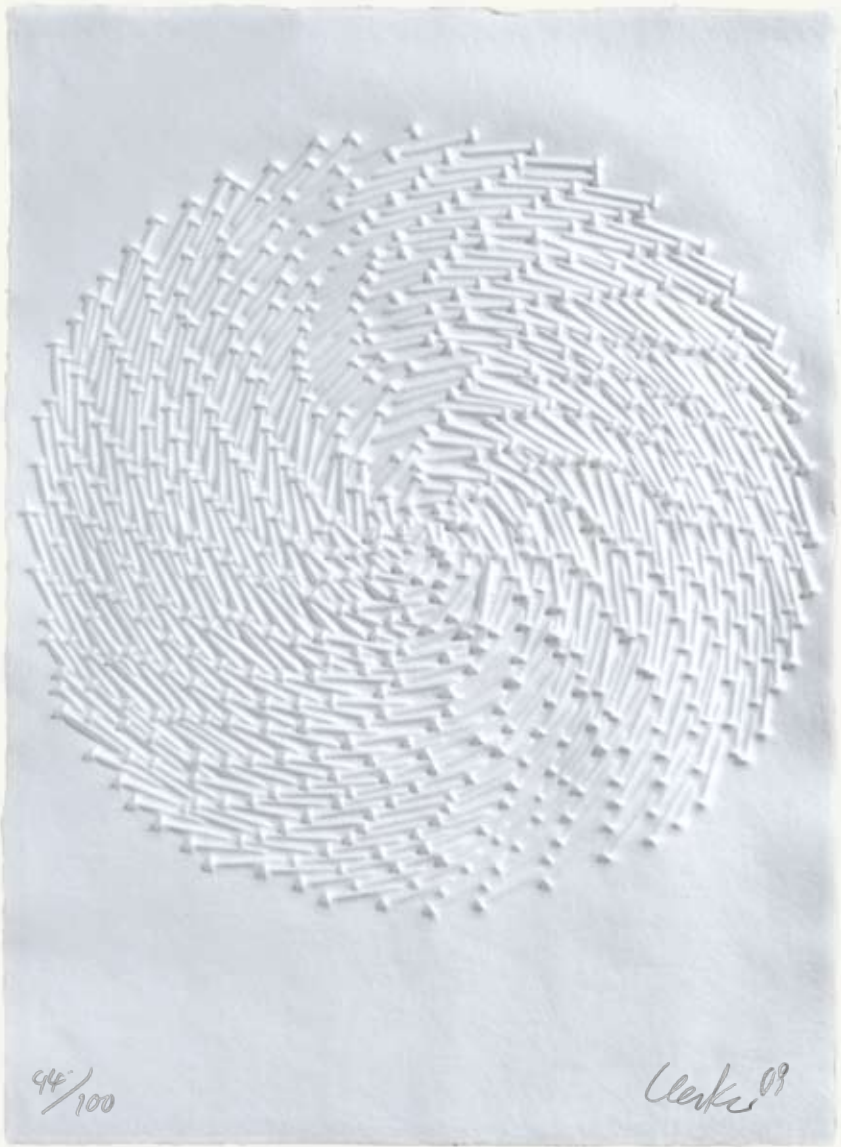
Günther Uecker Jahresgabe 2009 für das Mönchehaus Museum Goslar