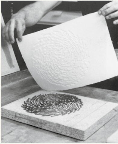
Herstellung eines Prägedrucks in der Erker-Galerie, St. Gallen