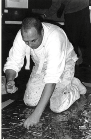
Günther Uecker bei der Arbeit am »Goslarer Schutzschild«, 1989