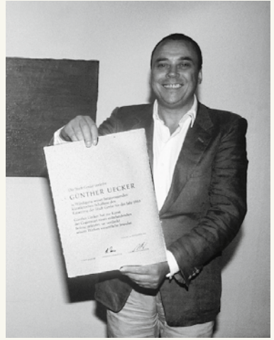
Günther Uecker mit der Kaiserring- urkunde 1983