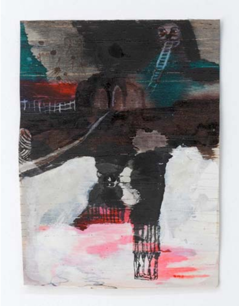
Christof Mascher | Your Problems 2007 | 10,2 x 7,6 cm | Tinte auf Holz | Mönchehaus Museum Goslar 2008