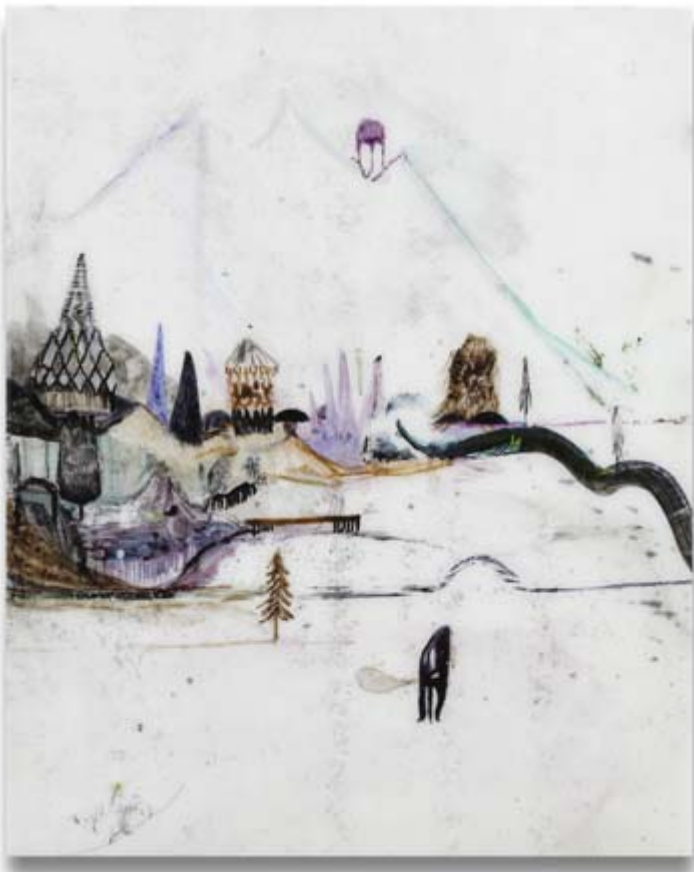
Christof Mascher | Keep on Waiting 2007 | 29 x 23,5 cm | Tusche, Bleistift und Firnis auf Holz | Mönchehaus Museum Goslar 2008