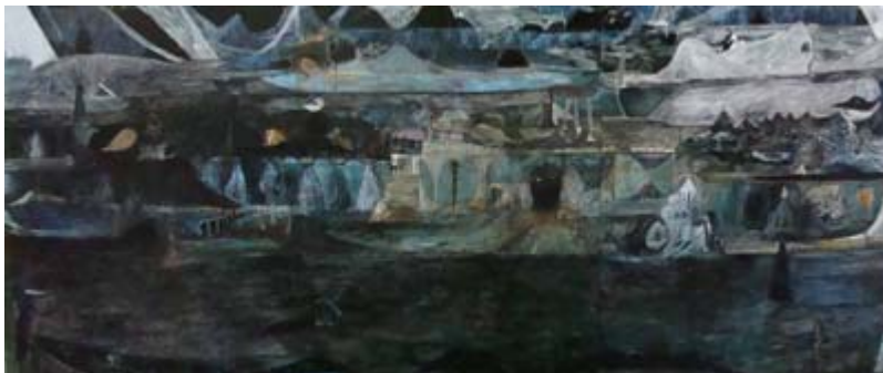
Christof Mascher | Loom 2007 | 267 x 621 x 6,5 cm | Öl auf Holz Courtesy: Galerie Michael Janssen, Berlin | Mönchehaus Museum Goslar 2008

Zur Ausstellung wird ein Katalog erscheinen.