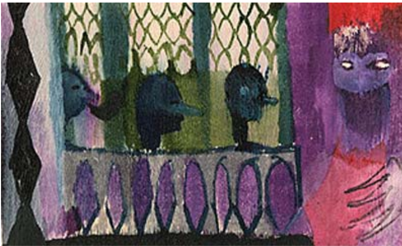
Christof Mascher | Absentia 2007 | 6,4 x 10 cm | Tusche auf Holz | Mönchehaus Museum Goslar 2008