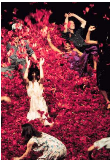
Der Fensterputzer, ©Foto: Jochen Viehoff

Das Mönchehaus Museum Goslar zeigt das filmische Werk von Peter Lindbergh an zwei Abenden.