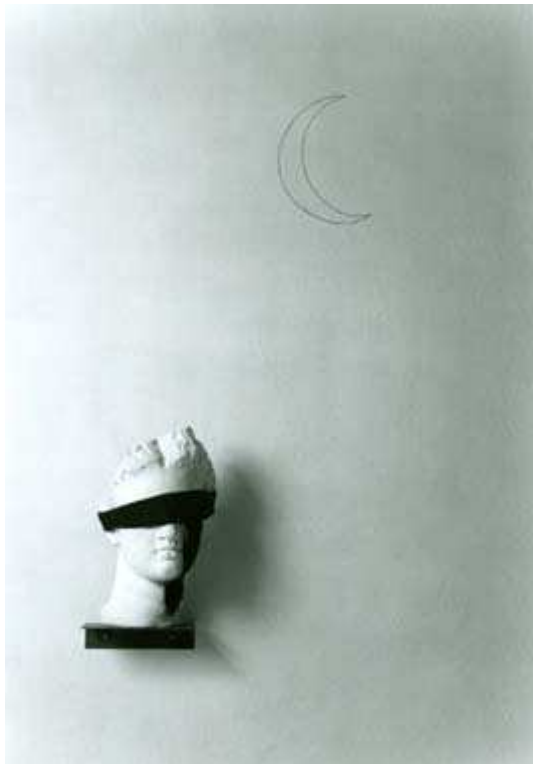
Jannis Kounellis, o.T., 1979, Bearbeiteter Gipsabguß, Stoff und Metallsockel sowie Bleistiftzeichnung, Schablone

Pressemitteilung - Mönchehaus Museum Goslar, April 2009