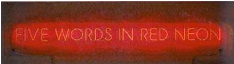
Josef Kosuth, Five Words in Red Neon, 1965, Neonschrift, 10 x 147 cm