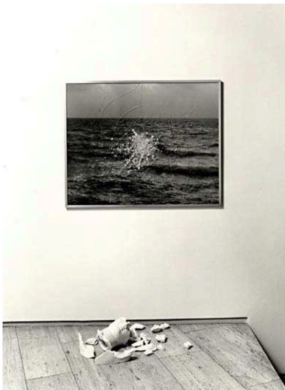
Giulio Paolini, Cythère, 1984, Photo, zersplittertes Glas, Gipsstücke, 102 x 128 cm